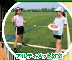
アルティメット教室

アルティメットは フリスビーでパスをつないで ゴールを目指すバスケットとアメフト を足したような競技です! 走る・投げる・跳ぶ! まさに究極のスポーツ!