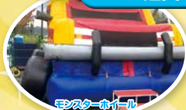
モンスターホイール