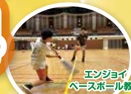
エンジョイ ベースボール教室

種 成獣の部 (中学生以上) オス・メス (男性・女性) 目 幼獣の部 (小学生以下)