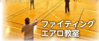
ファइटニングエアロ教室