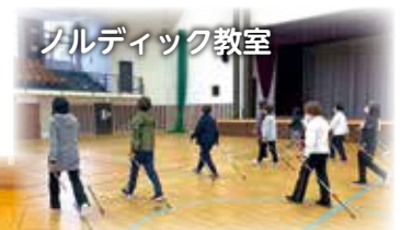
ノルディック教室