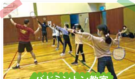
バドミントン教室