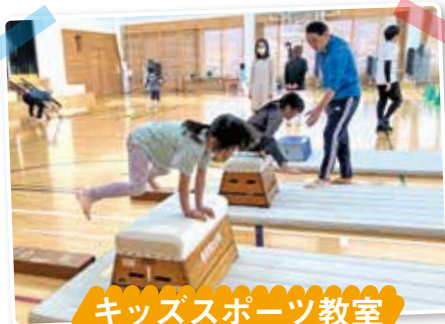
キッズスポーツ教室