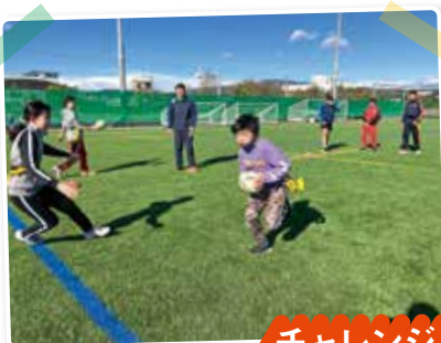
チャレンジスポーツ教室