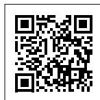
▲ fun スポ伊達 HP