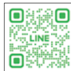
▲ 公式 LINE