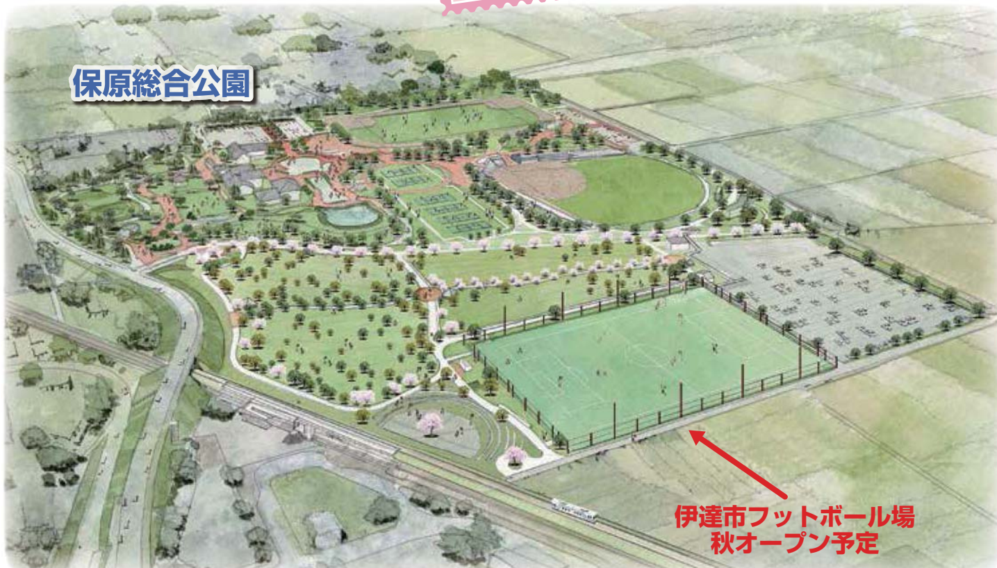
伊達市フットボール場 秋オープン予定