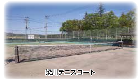
梁川テニスコート