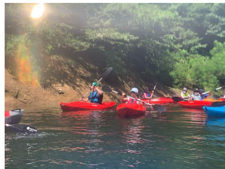
最初は、力が入って上手く進まず・・・