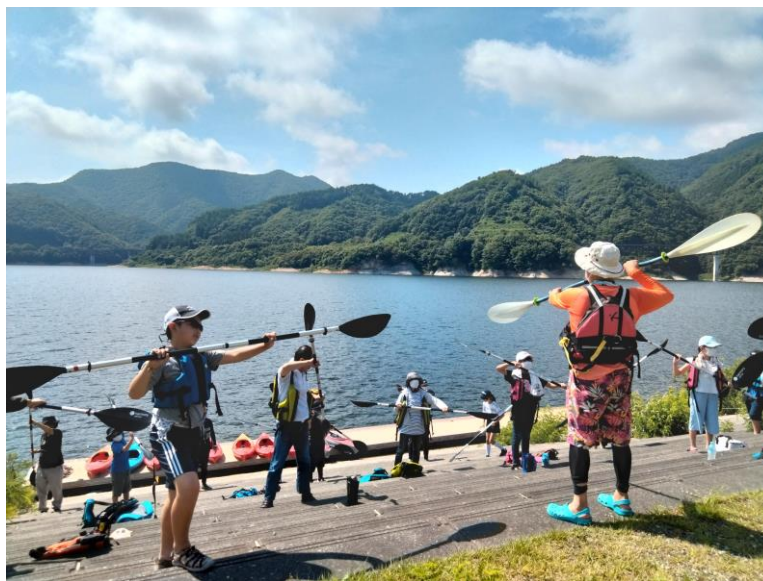
パドルの使い方を・カヤックの乗り方講習