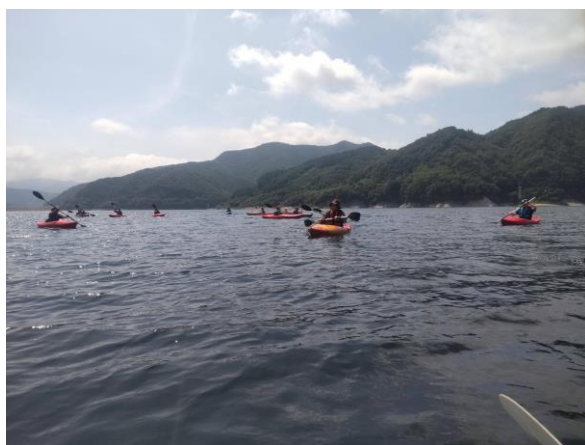
開放感もあり夏休みのいい思い出に♡