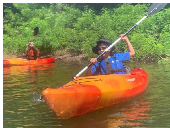
慣れてきてスイスイ進んで楽しい★