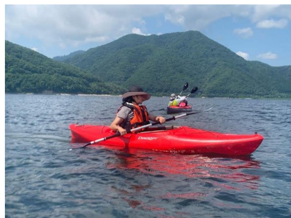
ぐるっとダムを周回！気持ち良くて最高！