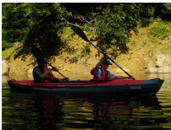
2人乗り！お父さんと力を合せて！