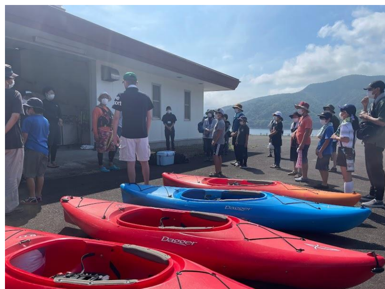
今回使用したカヤック 結構重たくてビックリ！

対象：伊達市内小学生 4年生～6年生の児童・保護者 天気は、晴れ☀ 時より心地よい風を感じながらカヤック体験教室を楽しみました。