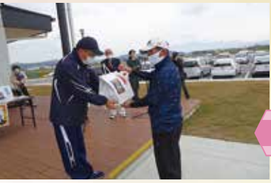
お楽しみ抽選会も開催